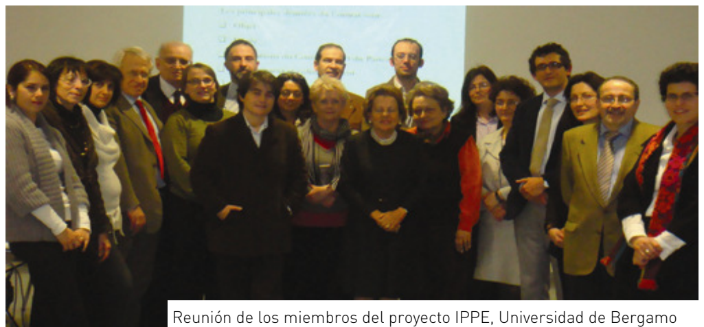
Reunión de los miembros del proyecto IPPE, Universidad de Bergamo

Los derechos colectivos es esencialmente el derecho de participación de los padres en las estructuras formales organizadas para el sistema educativo.